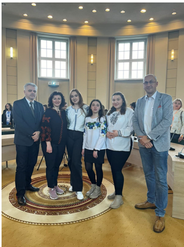
Усі учасники Літньої мовної школи «Міжнародні полоністичні студії» отримали сертифікати.